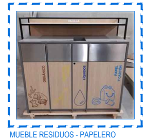
MUEBLE RESIDUOS - PAPELERO